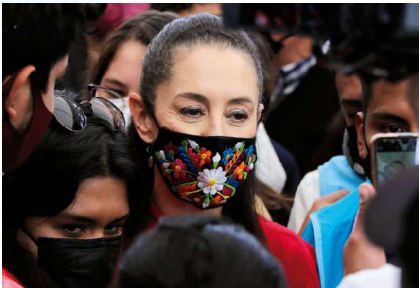
VIRAJE. Tras el saldo electoral del 6 de junio, la jefa de Gobierno decidió retomar los eventos públicos.